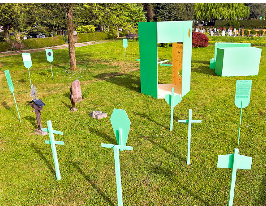
Schautafeln mitten auf dem Friedhof erläutern Bräuche und Rituale rund um die Bestattung.

So erfahren Besucher:innen gleich beim Eingang des Friedhofs, dass «Andersgläubige» erstmals 1782 eine letzte Ruhestätte auf dem Friedhof des damaligen Bürgerspitals fanden. Als 1885 der städtische Friedhof Friedental eröffnet wurde, war es Katholik:innen noch nicht erlaubt, sich kremieren zu lassen. Gleichwohl wurde eine Parzelle für den Bau eines Krematoriums