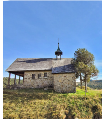
Kapelle Seewenalp

Zusammen mit der Älplerbruderschaft Fürstei feiern wir am Sonntag, 19. Juli, um 11.30 Uhr , einen Gottesdienst auf der Seewenalp. Herzliche Einladung!