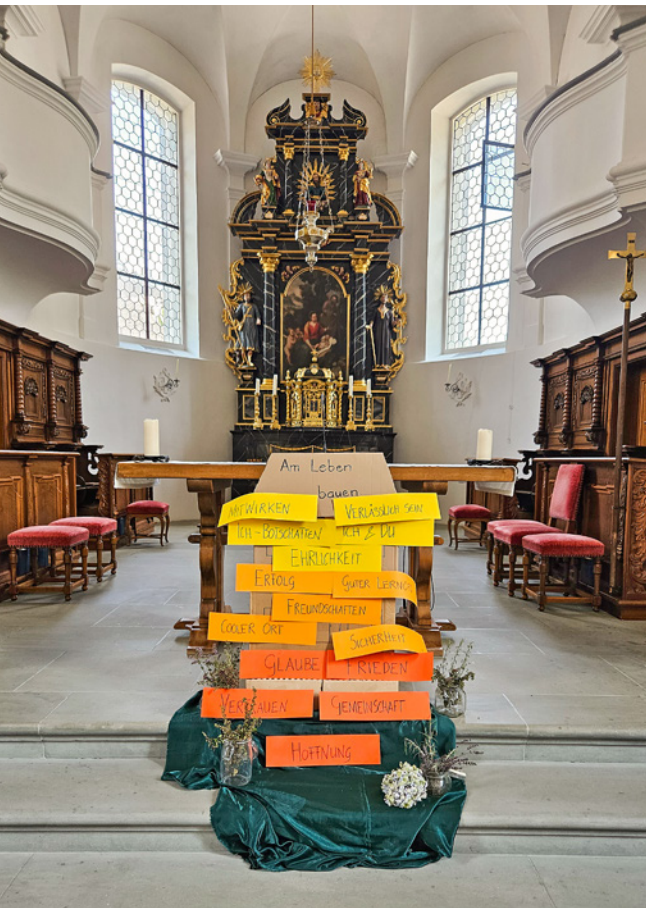
Dekoration am Schuleröffnungsgottesdienst

Das Schuljahr 2025/26 stand unter dem Motto «Am Leben bauen» und begann am 18. August 2025 mit einem feierlichen Eröffnungsgottesdienst. Nun, nach intensiven Monaten voller Lernen und gemeinsamer Erlebnisse, neigt sich das Jahr dem Ende zu. Am Freitag, 3. Juli , laden wir herzlich zum Schulschlussgottesdienst um 08.30 Uhr ein, der von Schülerinnen und Schülern mitgestaltet wird. Gemeinsam wird auf das Erreichte zurückgeblickt und der Schulschluss gefeiert.