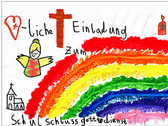
Zeichnung: Andrin Bucher