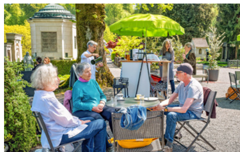
Das Friedhofscafé in einer Aufnahme vom Mai 2023, kurz nach der Eröffnung.

Das Café, das jeweils im Sommerhalbjahr betrieben wird, blickt auf ein «erfolgreiches Jahr 2023 mit hochmotivierten Freiwilligen» zurück und steht mitten in der vierten Saison. Den Betrieb ermöglichen 50 Freiwillige und 20 Personen, die Kuchen backen.