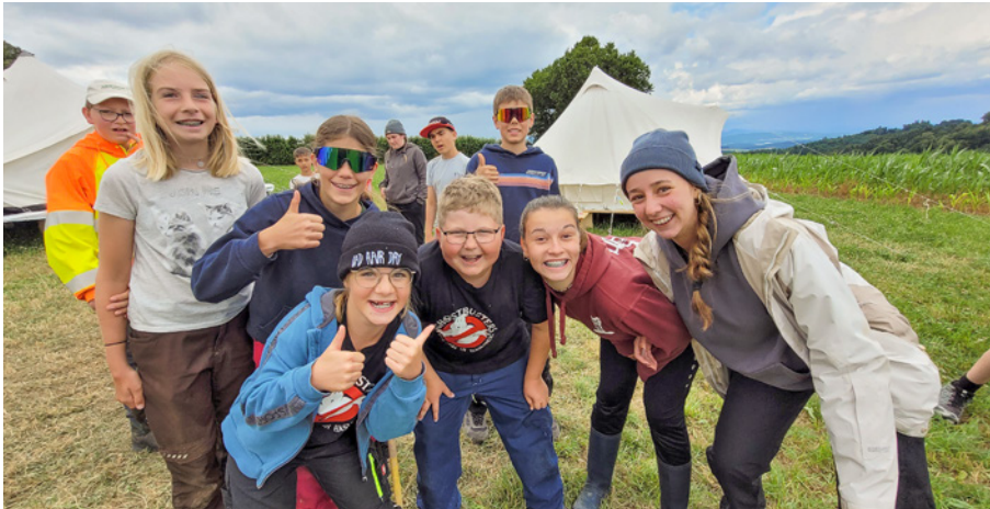
Momentaufnahmen aus dem Sommerlager 2025.