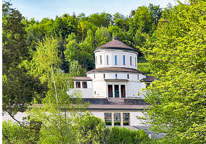
Das alte Krematorium auf dem Friedhof Friedental in Luzern.

Frieden im Tal, bis 15.11., jeweils 9–17 Uhr friedenimtal.ch