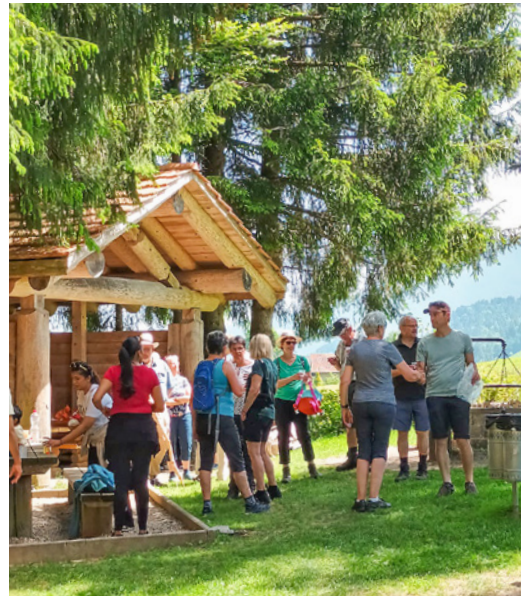
Rastplatz auf dem Weg von Escholzmatt nach Schüpfheim