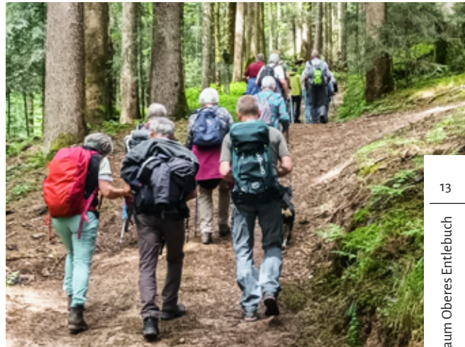
Auf dem Weg von Wiggen nach Escholzmatt