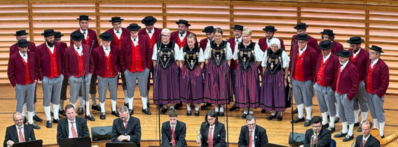
Das Jodlerchörli Lehn aus Escholzmatt bei einem Auftritt im KKL.