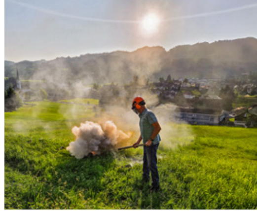
Das Bild aus dem Jahr 2025 zeigt ein Schüpfheimer Herrgottskanonier in Aktion.